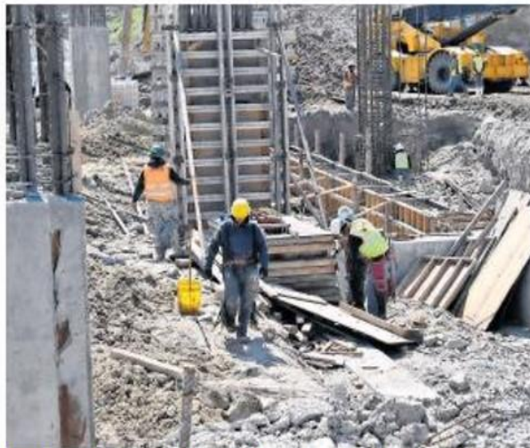
Estos aumentos han elevado los costos en el sector de la construcción